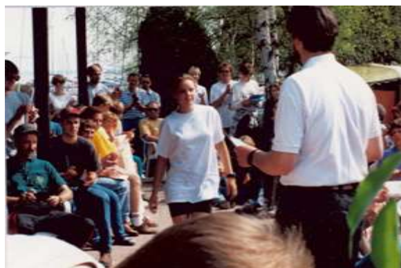
1. Platz Damen, 1. Mistral Regatta 1997 beim YCN Amelie Lux, Silbermedaillengewinnerin bei den Olympischen Spielen in Sydney 2000, später in Athen 7. Platz. Amelie Lux gilt als die bisher erfolgreichste Surferinnen Deutschlands.