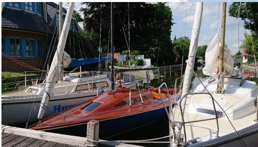
Am Paulaner Steg, Großenheidorner Graben