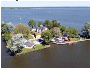
Anlegen am Wilhelmstein